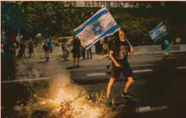
ההפגנות השבוע. מהלך לגייס או חציית גבול?

בשבוע שבו המחאה עלתה מדרגה, נזכרנו כי עמדות הפוליטיקאים בסוגיות הללו משתנות לא אחת בהתאם לזהות המפגינים • וגם: מה אומר החוק היבש על קריאה לסרבנות, ואיזה עונש אפשר להטיל על מי שחוסם כבישים