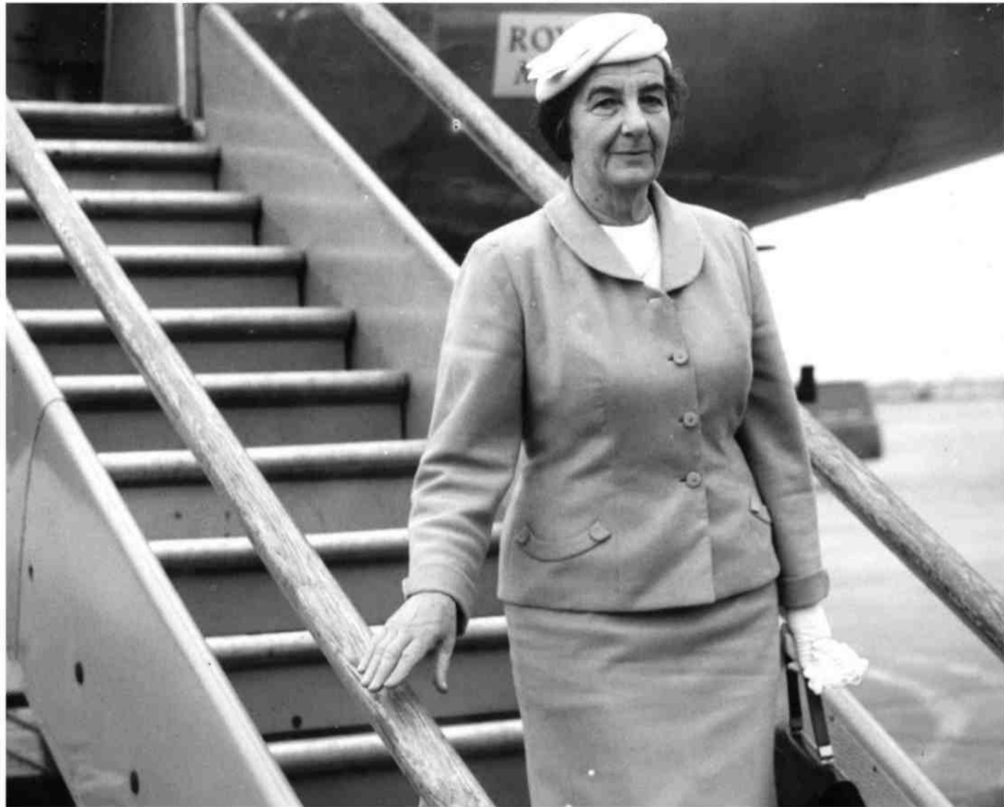
עוד מוקדם להשוות: גולדה הגשימה מערכת סודרה של זכיות נשים ודיברה עם מנהיגי העולם בגובה העיניים. גולדה מאיר, 1958

או לא – זו שאלה מעניינת כשלעצמה. אני לא מכיר תקדים כזה במקומות אחרים. אבל יש שאלה – משהו מוקדם שאני כבר יכול להגיד: אם יש לנו עבירת שוחד (בספר החוקים) מאוד רחבה – תיקח ליד את חוק העונשין, תראה ליד העבירה רשומים באותיות קטנות תיקונים מהשנים האחרונות.