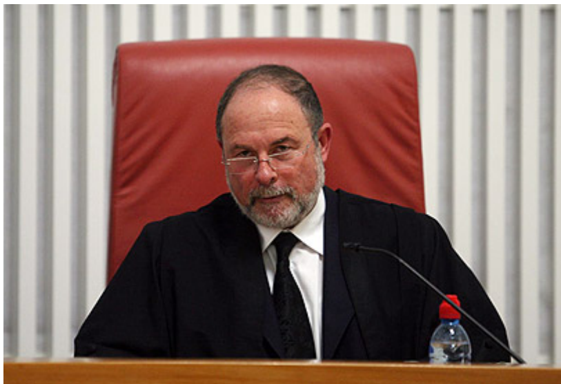
כמעט הודח. השופט יורם דנציגר חזר לבית המשפט העליון

השלישית , כשפרקליט המדינה הסמיך עצמו כביכול להדיח שופט מתפקידו. הוא עשה זאת באמצעות המלצתו לסגור את התיק המיותר נגד שופט של בית המשפט העליון, יורם דנציגר , בנימוק המכתיב "היעדר ראיות". בסופו של דבר לא קיבל היועץ המשפטי לממשלה המלצה נפסדת זו, והחליט שהתיק ייסגר "מחוסר אשמה", כראוי.