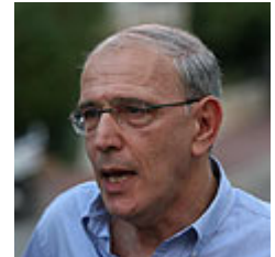
שורת תקלות. בלי פיקוח. פרקליט המדינה

השנייה , כשהחליטו בפרקליטות להגיש כתב אישום תקדימי ויצירתי מדי, המייחס לאדם שפיתה צעירה תוך התכתבות באמצעות האינטרנט לאונן אל מול מצלמת המחשב, דווקא את עבירת האונס, תוך פחות מעמדה של עבירה זו, שהייתה עד כה השנייה בחומרתה רק לעבירת הרצח.