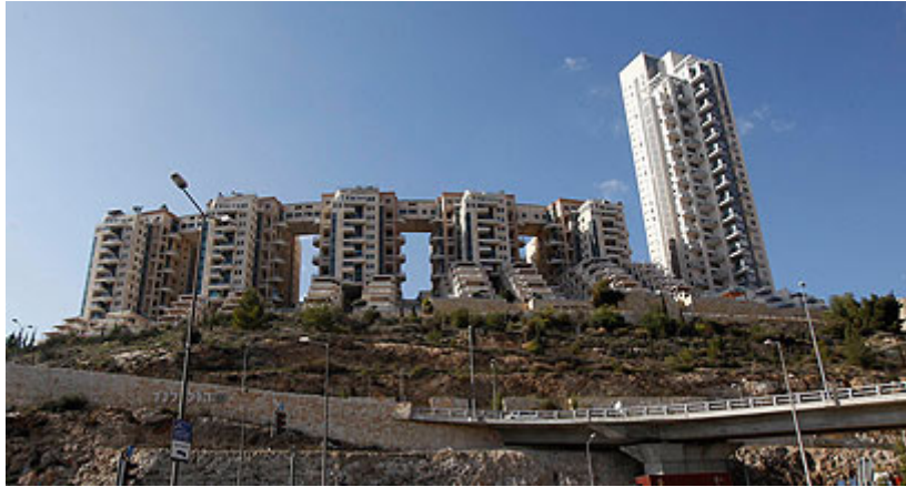
כל האמצעים כשרים לטובת אישומי הוילנד?

בעיקר על הפרסומים בעיתונות, אך אפילו רק מחציתו נכון, דרך ההתנהלות של הפרקליטות ושיקול הדעת של העומדים בראשה מעוררים סימני שאלה שיש לבררם ביסודיות.